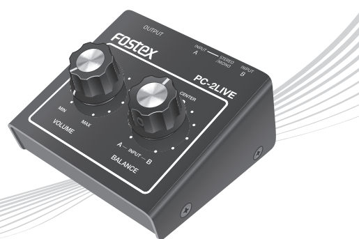
© FOSTEX COMPANY All Rights Reserved.

Thank you very much for purchasing a Fostex product. This manual provides instructions for basic use of the unit. Read this before using the unit for the first time.