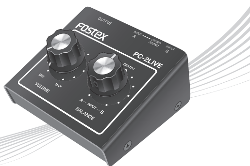
© FOSTEX COMPANY All Rights Reserved.

フォステクス製品をお買い上げいただき、誠にありがとうございます。 本書は、本機の基本的な使いかたについて説明しています。 本機を使い始めるときにお読みください。