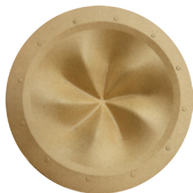
1層目(基層)を抄紙した状態

●ウーハーに世界初*16cmHR形状2層抄紙振動板を採用。体で感じる低音を実現させ低音の質と量を高次元で両立させるため、フォステクスの2Wayスピーカーシステムでは最大口径となる16cmHR形状2層抄紙振動板ウーハーを新たに開発しました。