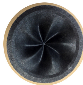
1層目の上に2層目(表層)を抄紙した状態

●バスレフダクトをエンクロージャー底面に設け、インシュレーターとベースボードを標準装備。上質で豊かな低音を再生するとともに設置の影響を最小限にして、どのような場所に設置しても一定の性能を発揮できるように設計してあります。