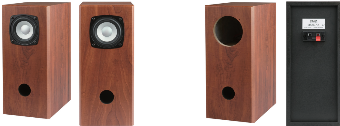
M800取付例 ※M800-DBにはM800は含まれません