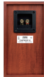
< リア >